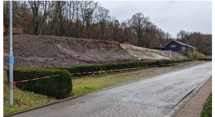
Baufeld neben dem Museum

Nicht erwähnt wurde im traditionellen Bericht des Ortsbürgermeisters Füllberg die Tatsache, dass sich eine deutliche Mehrheit der Bewohner der zur Ortschaft Oldendorf gehörenden Einwohner des Risckamps schriftlich dafür ausgesprochen haben, die Ortschaft wechseln zu wollen.