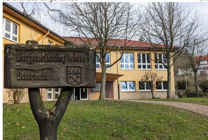
Das DGH als Leuchtturm