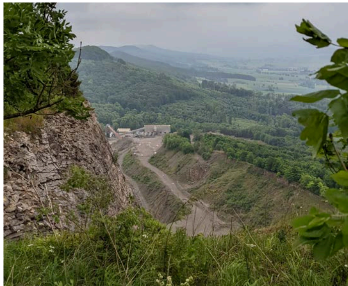
Heute noch ein großes Loch im Berg - Der geplante Deponiestandort

Wenn es durch die Deponie zu Beeinträchtigungen in der Wasserversorgung der Gemeinde kommen sollte, so wird auch Osterwald unmittelbar von den anfallenden Mehrkosten im kommunalen Wasserverbund betroffen sein. Außerdem wird eine beeinträchtigte regionale Attraktivität des Fleckens Salzhemmendorf auch an den Grundstücks- und Hauspreisen der Osterwalder nicht spurlos vorbeigehen. Wir alle haben also gute Gründe, uns gemeinsam gegen die geplante Deponie und ihre negativen Folgen für die angrenzenden Gemeinden zu wehren.