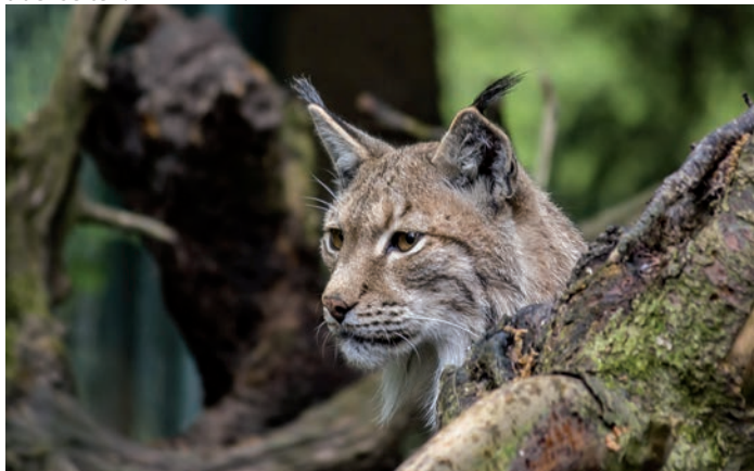
Symbolfoto Luchs

Bei Nutztierhaltern ist vor allem Skepsis gegenüber dem Luchs anzutreffen. Grundsätzlich ist der Luchs in der Lage, Weidetiere wie Schafe oder Ziegen zu erbeuten. Übergriffe dieser Art sind nach den Erfahrungen beispielsweise aus dem Harz, wo der Luchs schon länger anzutreffen ist, aber selten.