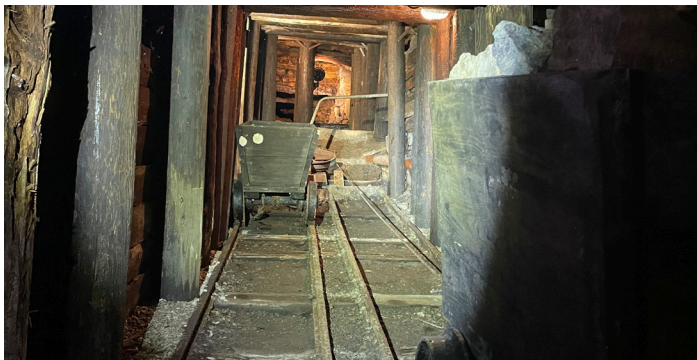
Ein Blick ins Bergwerk

Der Hüttenstollen als Besucherbergwerk mit dem zugehörigen Museum gilt als ein Wahrzeichen des Bergorts Osterwald. Wie in jedem Jahr haben die Frauen und Männer des Vereins zur Förderung des Bergmannswesens Osterwald e.V. ein umfangreiches, interessantes Programm für das Jahr 2023 aufgestellt.