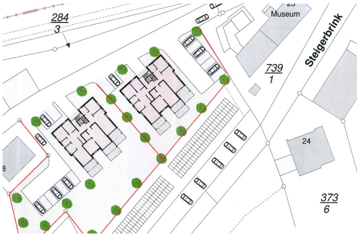
Auszug aus der Planunterlage

Weitere Tagesordnungspunkte betrafen eine in Osterwald geplante Baumaßnahme, für die zunächst der Flächennutzungs- und der Bebauungsplan durch den Flecken Salzhemmendorf geändert werden muss. Auf der Grünfläche zwischen Kurhaus und Bergmannsmuseum möchte der Eigentümer zwei Gebäude mit mehreren Wohnungen errichten.