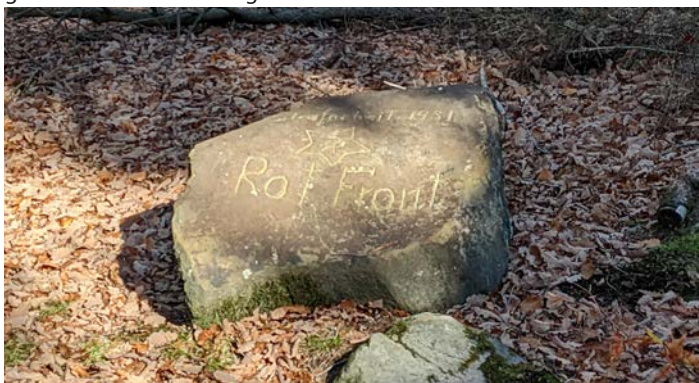
Gedenkstein an eine Strafarbeit

Da es keine schriftlichen Aufzeichnungen gibt und die beteiligten Personen alle nicht mehr leben, stützt sich der Artikel auf mündliche, glaubhafte Überlieferungen.